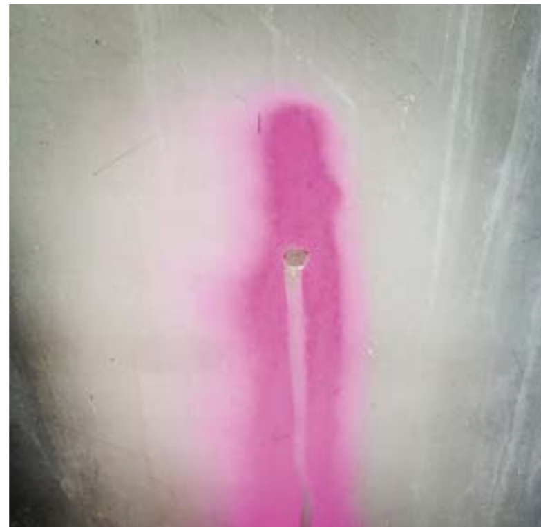
▲ РАКЕТА. Мобильный институт. 2014. © r a k e t a РАКЕТА, Mobile Institute, 2014. © r a k e t a